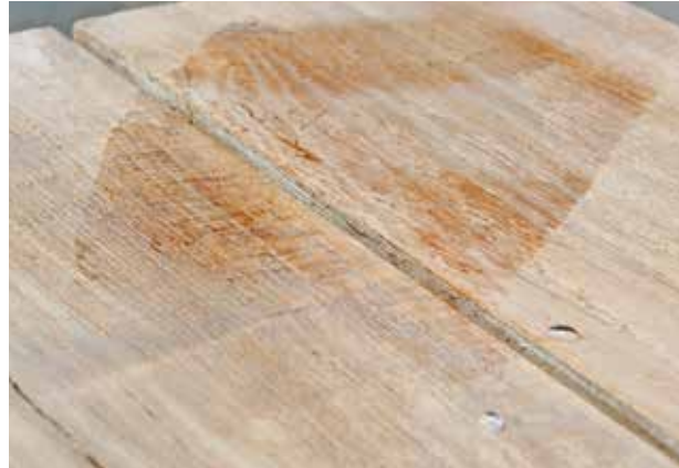
na 5 min.