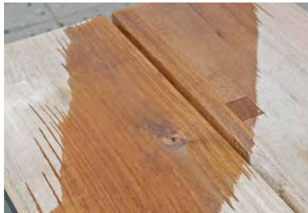
na 5 min.