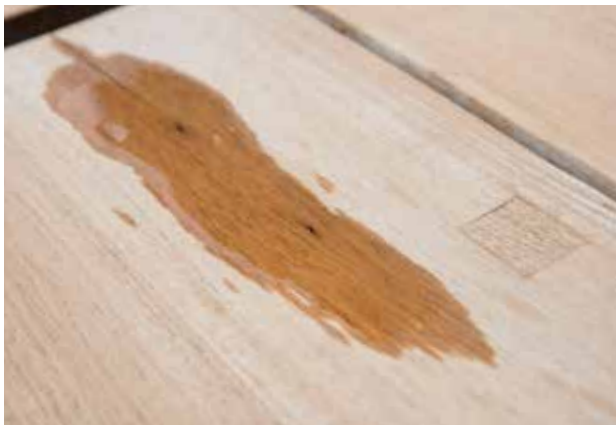
net nat gemaakt