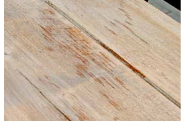
na 10 min.