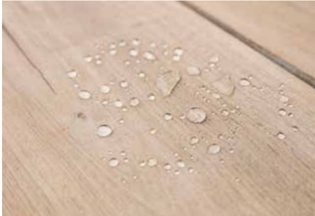
net nat gemaakt